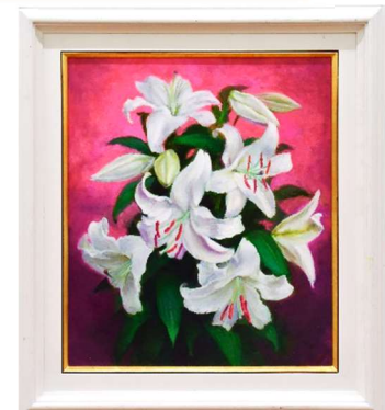
「カサブランカ」 (油彩)

猫の手で描いたような私の拙い絵を、立派な広い会場に、毎年、10年間にわたり、安い出品料で、展示して頂き、感謝しております。その上メダルまで戴くとは！有難う御座います。