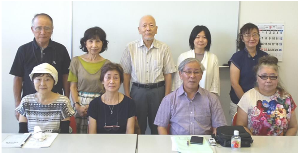
<今年度の正副会長・全理事>